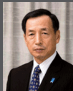
田母神俊雄前空幕長