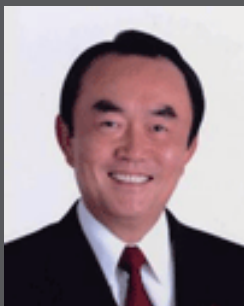
大会会長平沼赳夫

また新潟県において決議された、「対馬における外国人による土地取得に関する意見書」を手本とし、全国の地方自治体における同様の決議を目指す。